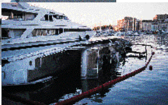
Lors d'un sinistre, l'expertise est primordiale.