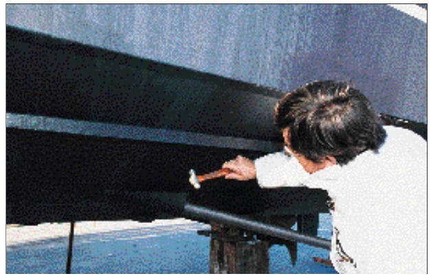
L'usage du marteau permet de juger de l'état de la coque.

En France, il existe deux organisations professionnelles d'experts "plaisance", la Fédération Internationale des Experts Maritimes (F.I.E.M.) et la Chambre Nationale des Experts Professionnels du Nautisme (C.N.E.P.N.). Leurs membres sont généralement reconnus et expérimentés, mais leur agrément n'impose aucun contrôle de connaissances ni obligation de formation continue. Alors qu'aux Etats-Unis par exemple les deux organisations d'experts: The Society of Accredited Marine Surveyors (S.A.M.S.) et The National Association of Marine Surveyors (N.A.M.S.), en plus d'imposer un code de déontologie, ont mis en place un processus rigoureux de recrutement, d'agrément et de formation continue qui est sans doute plus objectif. Pour être accrédité ou certifié, les experts membres doivent justifier d'au moins cinq ans d'expérience et passer un test de connaissances. De plus, afin de conserver leur agrément, ils doivent participer à des sessions de formation. Ainsi, tous les cinq ans, s'ils n'ont pas participé à un certain nombre de ces sessions, ils doivent repasser le test. Ces séminaires couvrent des sujets aussi variés que la réparation des coques en composites, les normes internationales, la rédaction d'un rapport ou la conduite d'une expertise contradictoire dans le cadre d'un sinistre. Les membres de ces organisations sont généralement reconnus et largement missionnés par les particuliers et les compagnies d'assurances.