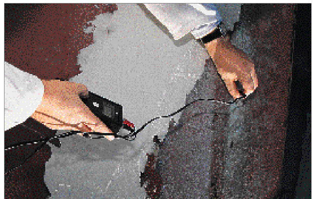
La sonde à ultrasons permet de mesurer l'épaisseur des tôles d'aluminium et d'acier.