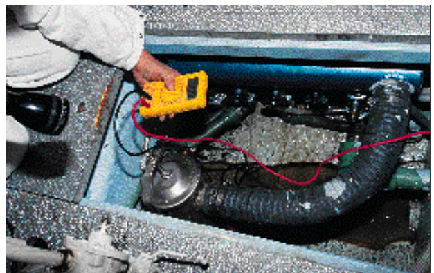
L'usage du voltmètre permet de mesurer l'efficacité de la protection cathodique.