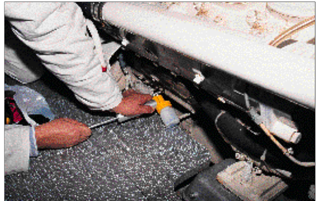
Les prélèvements d'huile moteur sont une aide au diagnostic.